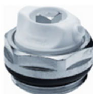
Afb. 8. Ontluchtungsventiel