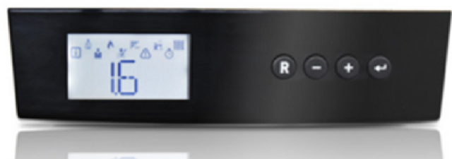
Afb. 4. Display cv-ketel met weergave installatiedruk