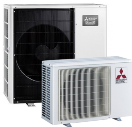
Afb. 2. Buitendeel combi warmtepomp voor verwarming en warm tapwater