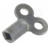
Afb. 7. Ontluchtungsleutel

Let op! Draai nooit de spindel helemaal uit het ventiel!