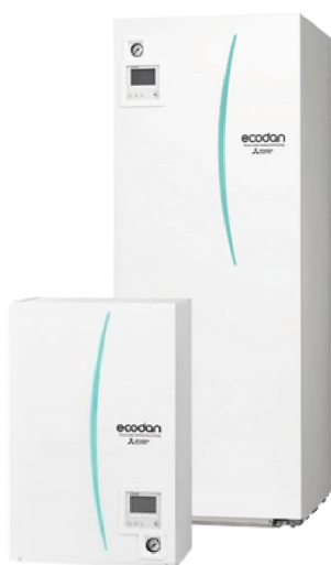
Afb. 2. Binnendeel lucht-water warmtepomp