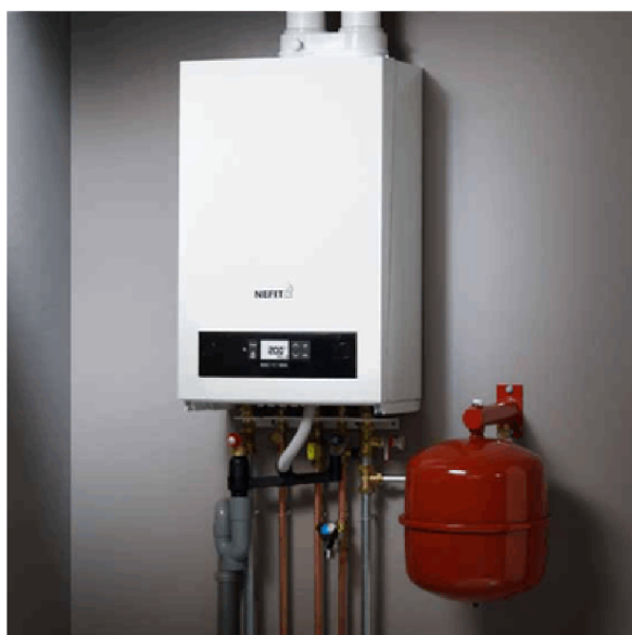
Afb. 1. CV-ketel