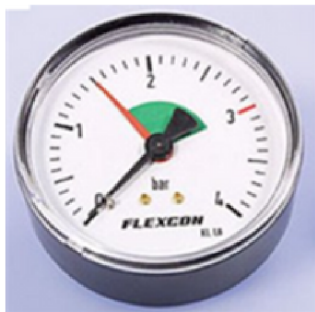
Afb. 3. Manometer

In deze stadsverwarmingsinstallaties wordt centraal de druk geregeld. Deze worden indien nodig ook centraal bijgevoerd. In de woning hoeft dus enkel ontlucht te worden( instructie zie pagina 7). Bijvullen in de woning is bij dit type stadsverwarming installatie niet nodig.