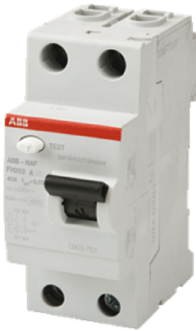
Afb. 2. Aardlekschakelaar