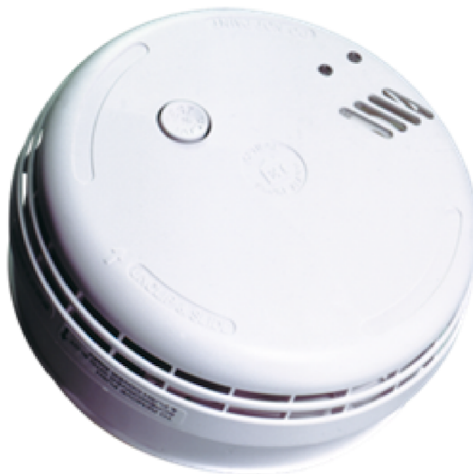
Afb. 3. Rookmelder