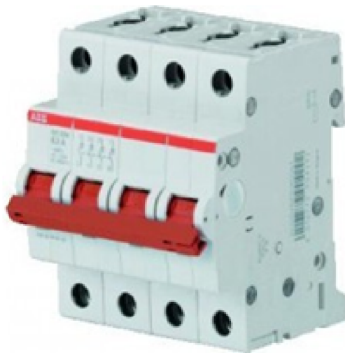
Afb. 4. Hoofdschakelaar

Om veilig aan de installatie te kunnen werken moet de 'hoofdschakelaar' (Afb. 4) uitgeschakeld worden.